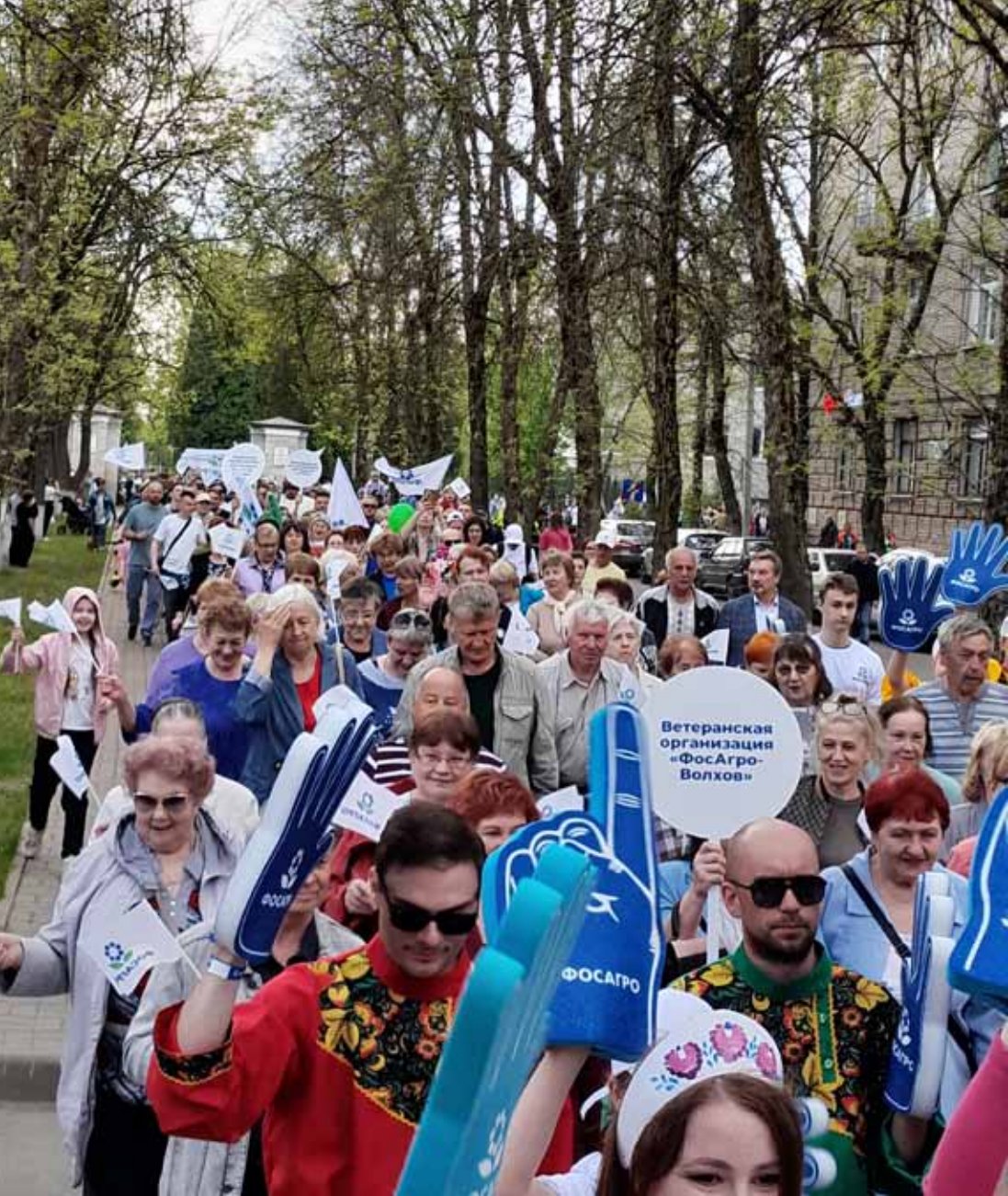
ШЕСТВИЕ ОРГАНИЗАЦИИ ВЕТЕРАНОВ ФОСАГРО (ВЫШЕДШИХ НА ПЕНСИЮ) ПО ПАРКОВОМУ БУЛЬВАРУ В ВОЛХОВЕ