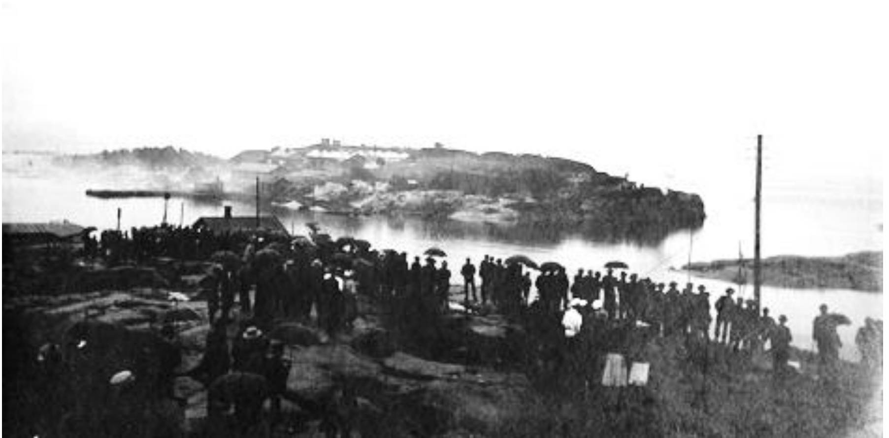
Helsinkiläisiä Ullanlinnan kalliolla seuraamassa Viaporin (Suomenlinnan) taisteluita